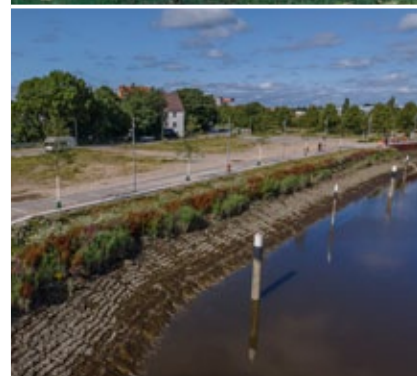
Biodiversität an der Böschung