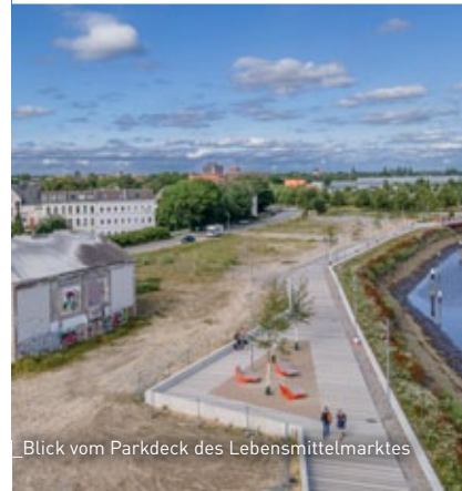
Blick vom Parkdeck des Lebensmittelmarktes