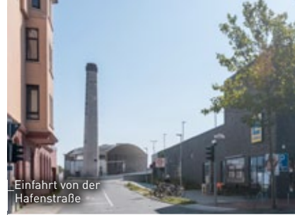
Einfahrt von der Hafensstraße