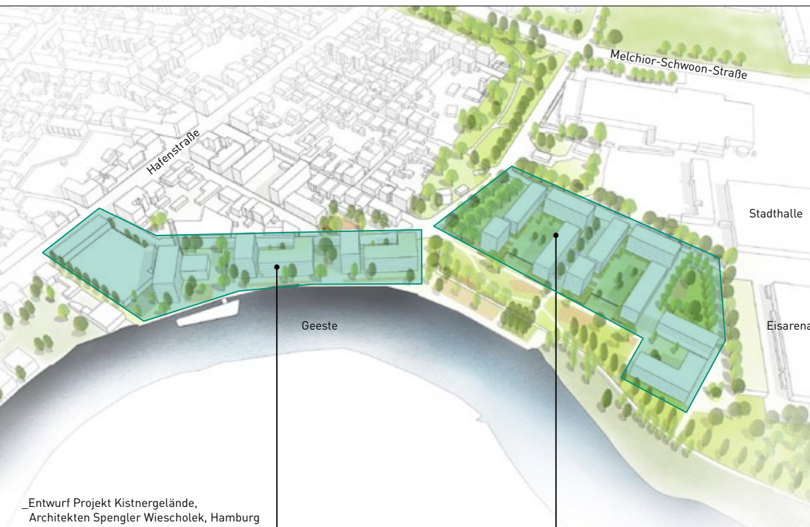
Entwurf Projekt Kistnergelände, Architekten Spengler Wiescholek, Hamburg

Größter Pluspunkt des künftigen urbanen Quartiers ist die Lage an der Geesteschleife. Das Wasser ist überall im Gebiet sichtbar und lädt zum Flanieren ein. Der beliebte Geeste-Wanderweg wird aus der Landschaft von Osten nach Westen über einen naturnahen Uferpark, eine Fluss-Promenade und öffentliche Plätze wie einen „Geestebalkon“ entlang geführt.