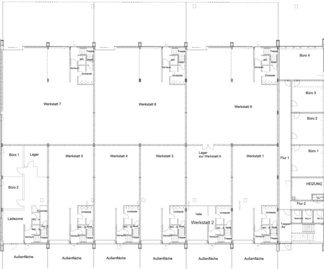
Gewerbehof Rudloffstraße 111: Erdgeschoss